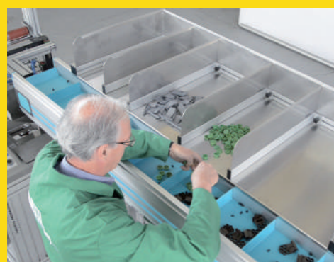
Tavolo multiscoparti e tappeto a passi