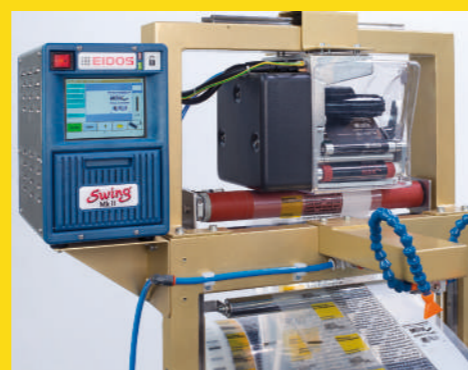
Stampante TTR su film