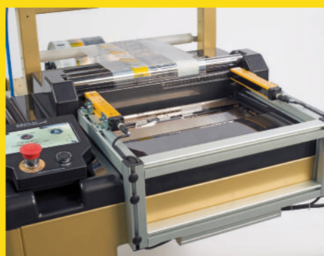
Start ciclo da inserimento prodotto