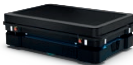
MiR Shelf Lift