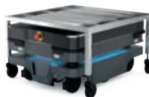
MiR250 Cart Carrier