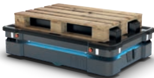
MiR EU Pallet Lift